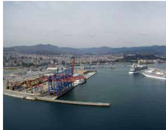
Imágen del puerto de Málaga.

El Plan de Acción Comercial se concibe como una herramienta dinámica, adaptable a la evolución de los mercados y a la incorporación de nuevos tráficos, y refuerza la posición del Puerto de Málaga como enclave estratégico en el ámbito marítimo-portuario nacional e internacional. Por otro lado, para el mejor funcionamiento del puerto, todas las semanas se realizan reuniones de mesas de trabajo entre la autoridad portuaria y los diferentes protagonistas del sector (operarios, transitarios, transportistas, SOIVRE, responsables fitosanitarios...) centradas en la toma de decisiones en la que los equipos selectos analizan problemas complejos, evalúan opciones y deciden la mejor línea de acción. Por último, ante la creciente demanda de servicios logísticos vinculados a la cadena de frío, el Puerto de Málaga ha decidido licitar un concurso para la construcción y explotación de un almacén de frío en el recinto portuario. ■