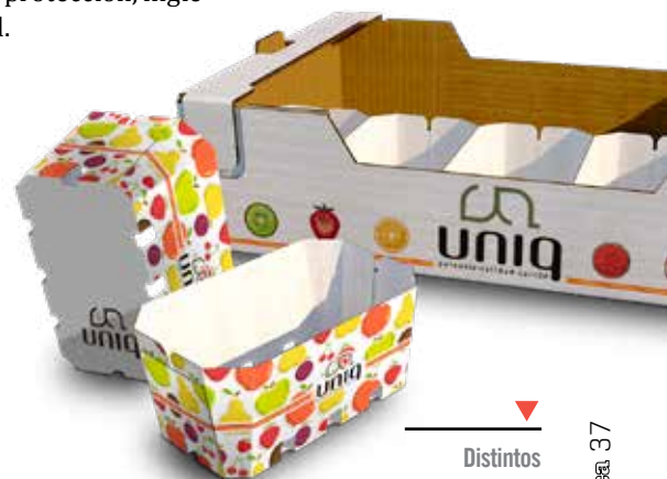
▼ Distintos envases agrícolas de UNIQ

En 2024, después del consumo de cartón ondulado para productos alimenticios en España, con una cuota del 33 por ciento, se sitúa el sector de productos agrícolas, con un 16,3 por ciento. ■